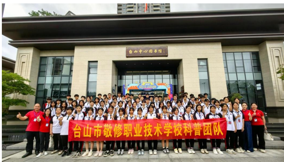
图 20 组师生团队参观“中国流动科技馆”广东巡展项目

2025 年 4 月 27 日，学校组织师生团队（共 80 人）参观“中国流动科技馆”广东巡展项目（台山站）》，此次活动激发了学生们的好奇心、想象力和探求欲，同时也开拓了学生们的科学视野。