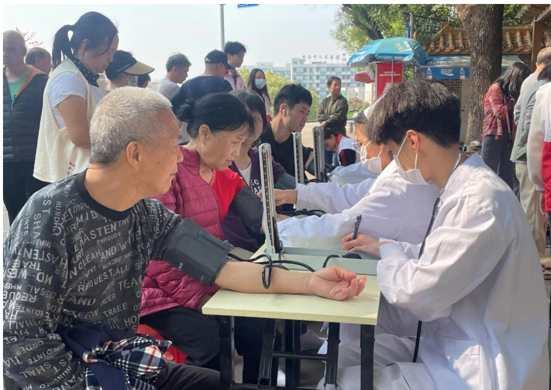
图 2 敬修职校医学部学生义务为居民测量血压

活动中，学校立足专业特色精准服务社会：医学部护理专业、药剂专业学生赴石化山广场开展健康公益服务，为 200 余名居民测量血压、普及急救及中医药知识。形象设计专业学生与学校摄影社走进敬老院，为老人定制造型、拍摄纪念照并制作相册，传承敬老美德。