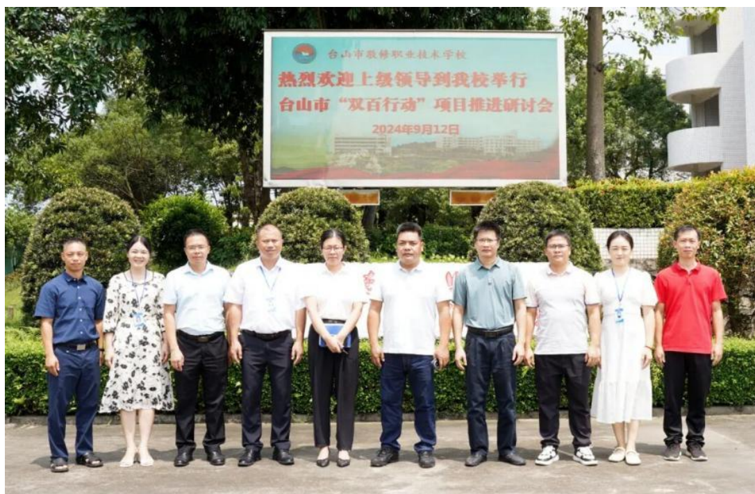
图 11 参加研讨会领导合影留念

2024 年 9 月 27 日至 11 月 28 日，敬修职校经贸部师生参加了由台山市“谭江杯”电商直播技能竞赛。