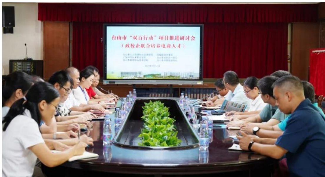
图 10 台山市“双百行动”项目推进研讨会在敬修职校召开