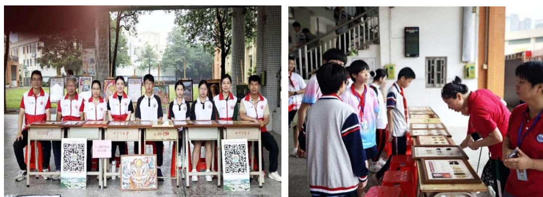
图 22 参加台山市育英中学首届科技节暨“青春集市”活动

普团队为现场观众展示了绘画作品、书法作品、漆艺作品、美甲作品的制作技艺，并现场教授心肺复苏等急救知识，取得良好效果。