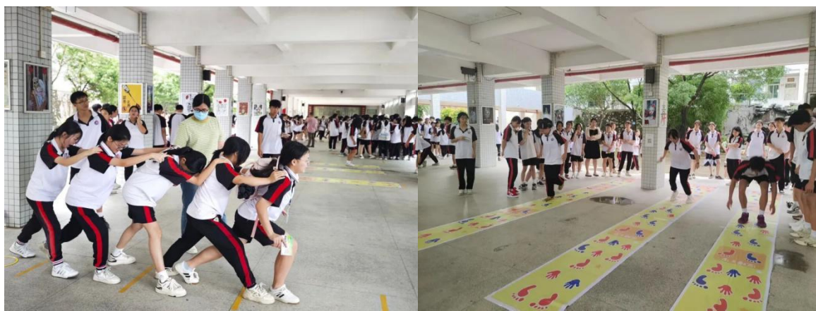
图 24 学校开展学生心理趣味游园会活动

立德树人是教育根本任务，学生心理健康是落实该要求的重要基石。敬修职校学生处于身心发展关键阶段，面临多重心理挑战，党总支立足“党建引领德育，育心赋能成长”理念，将学生心理健康教育纳入党建重点，统筹开展“党建引领育心赋能、趣味游园护航成长”主题心理趣味游园会，以党建红引领育心暖。