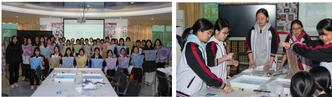
图 23 学校女生节活动

条丝巾都承载着同学们的创意与热情。大家相互欣赏、交流经验，现场掌声、欢笑声不断，在美育熏陶中感受艺术之美与创造之乐。