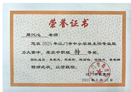
图 6 获市赛特等奖证书

为做好比赛的准备工作，学校统筹组建了备赛团队：由党总支书记任组长、校长任执行组长，分管德育副校长牵头统筹，省级班主任工作室提供专业指导，校内教师群策群力，形成“校级统筹+专家指导+团队助力”的备赛格局。学校 2023 年 11 月揭牌名班主任工作室，组建三大成长小组覆盖 30 名班主任。秉持“走出去，请进来”的理念，通过推荐班主任加入各级名工作室、选派骨干参加专项培训、举办成长故事演说视频大赛、开展心理沙龙等，搭建多维成长平台。同时以赛促建，赛前组织模拟练兵，赛后分享备赛经验，实现“一人参赛、全员受益”。