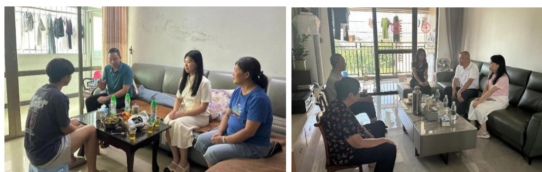
图 4 学校领导班子带队参与家访

为贯彻相关法律法规、构建家校社协同育人格局，学校于 2025 年 7 月开展暑假大家访，以暖心沟通架起家校共育桥梁，推动德育工作向家庭延伸。