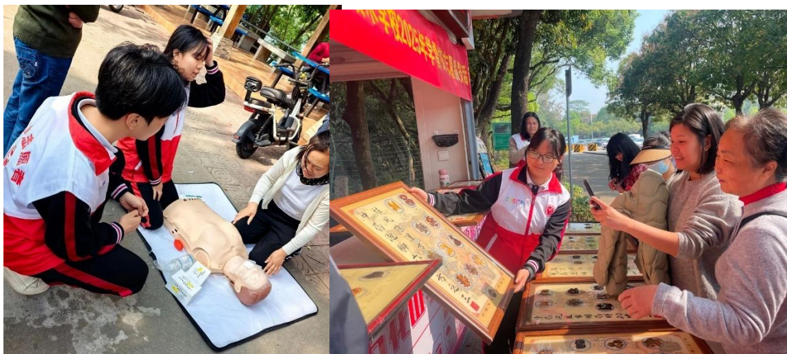
图 15 在石化山广场开展“公益服务暖民心”活动

2025 年 3 月 20 日，学校在石化山广场开展“公益服务暖民心”活动。护理专业学生为居民免费测量血压，药剂专业学生通过急救知识讲解、中医药材展示及互动体验等形式，吸引 200 余人次参与。居民积极体验急救模拟、药材辨识等环节，活动以专业服务传递健康关怀，有效提升社区居民健康意识，营造了互助和谐的社会氛围。