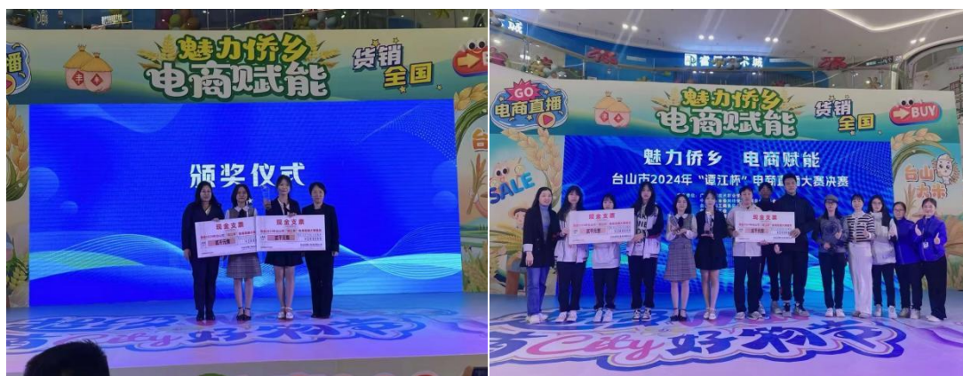
图 12 学校电商团队参加台山市“谭江杯”电商直播比赛角色

9 月 27 日，参赛师生团队到水步镇谭江米业采风，大家走进企业、走到田间，沉浸式了解产品生产流程。