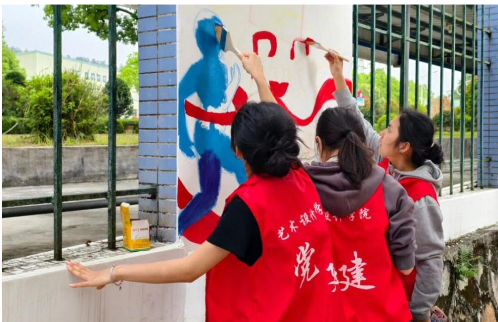
图 3 敬修职校与广科院艺术设计学院联合开展主题墙绘活动

为推进“百千万工程”、深化中高职“三二分段”衔接，2025 年 4 月 9 日，敬修职校联合广东科学技术职业学院开展党建带团建系列德育实践活动，探索“思政+美育+专业”协同育人新模式。