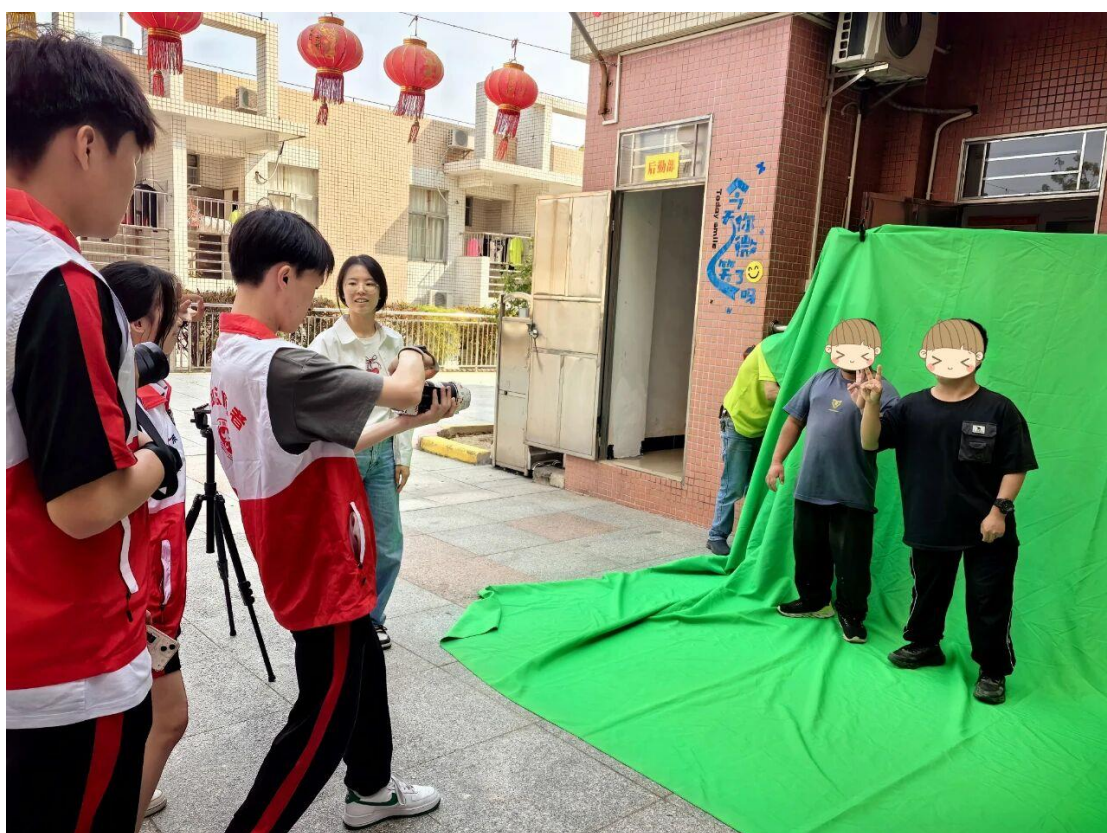
图 16 走进台山市敬老院开展“敬老爱老传温情”活动

2025 年 3 月下旬，学校组织形象设计专业师生与摄影社走进台山市敬老院开展“敬老爱老传温情”活动。形象专业学生为老人设计妆容造型，摄影社全程跟拍记录温馨瞬间。活动通过专业技能实践传递人文关怀，将长者风采定格成永恒记忆，后续制作相册赠送敬老院。活动不仅展现了青年学子的社会责任感，更以艺术形式架起代际沟通桥梁，让敬老传统在实践中传承延续。