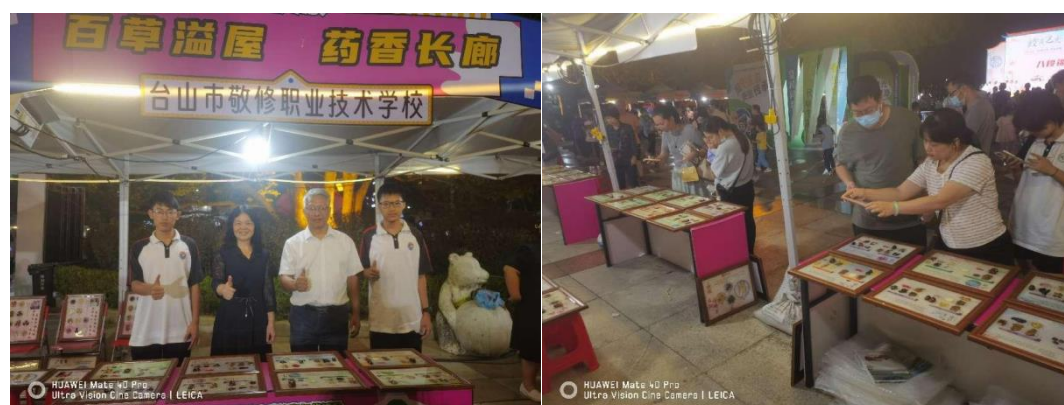
图 17 科普团队参加台山义诊活动 图 18 义诊嘉年华活动现场

2024 年 10 月 25 日、26 日，学校科普团队受邀参加台山“岐黄之光，照亮健康”——中医药夜市义诊嘉年华活动现场，大会为敬修职校安排 3 个展位，敬修职校的中药水晶板充满魅力，摊位前人头攒动，大人拿出手机拍拍拍，小孩面对中药标本爱不释手摸摸摸，大家都沉浸在中医药的神奇世界中。这次活动不仅加深了大家对中医药的了解和认识，更传递了健康和快乐的力量！