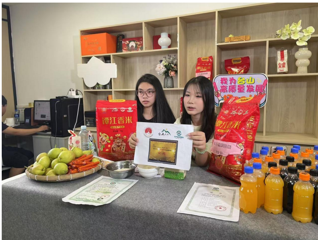
图 14 学校电商团队参加台山市“潭江杯”电商直播比赛

从前期准备到现场直播，师生们的表现都很棒。团队近半成员是“00”后学生，他们来自工艺美术专业和计算机专业电商直播方向，成员既有擅长摄影和美术的，也有擅长网络销售的，网络思维活跃且颇具创意。参赛学生不仅学习过电商直播相关课程，还借助校企合作平台，积累了丰富的直播带货实践经验。值得一提的是，学校从去年开始打造的直播实训中心，在此次大赛中迎来“对外首秀”。