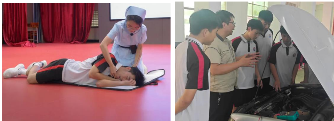
图 9 参赛青年教师授课风采

出极高的参赛热情与进取精神。经过初选，最终 8 位优秀教师脱颖而出，代表台山出征江门市赛。