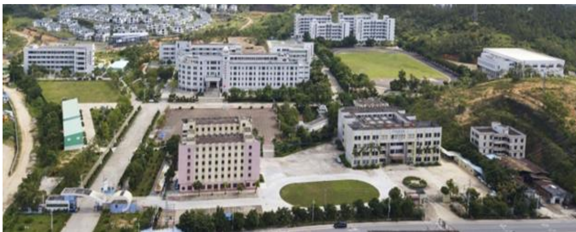
图 1 台山市敬修职业技术学校鸟瞰图

台山市敬修职业技术学校始建于 1922 年，是一所全日制公办普通中等职业学校，被评为广东省重点中等职业学校。2015 年，敬修职校与台山市卫生职业技术学校强强整合，实行“一套班子，统一领导”的管理模式。