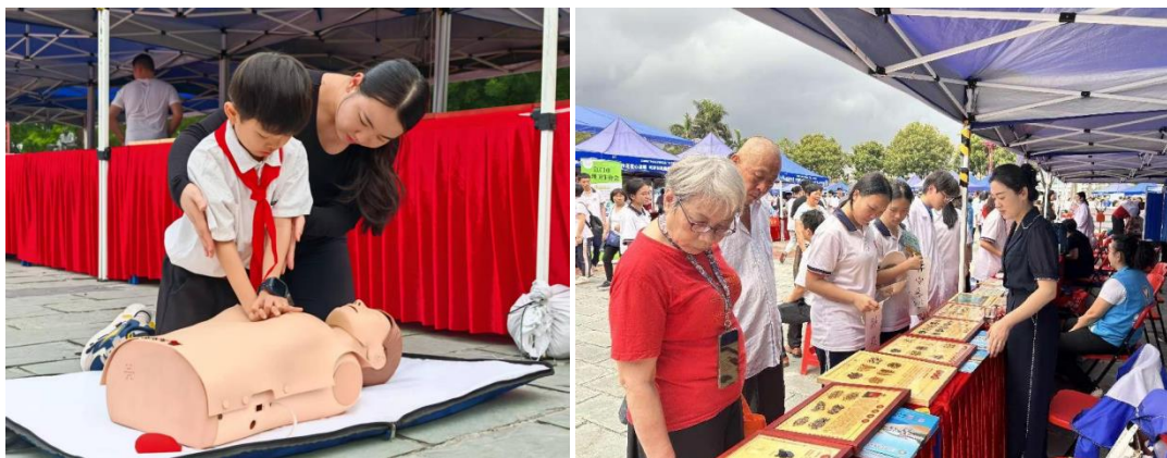
图 19 科普团队参加广东省文化科技卫生“三下乡”主场活动

2025 年 3 月 28 日，敬修职校科普团队参加广东省文化科技卫生“三下乡”主场活动，取得良好效果。