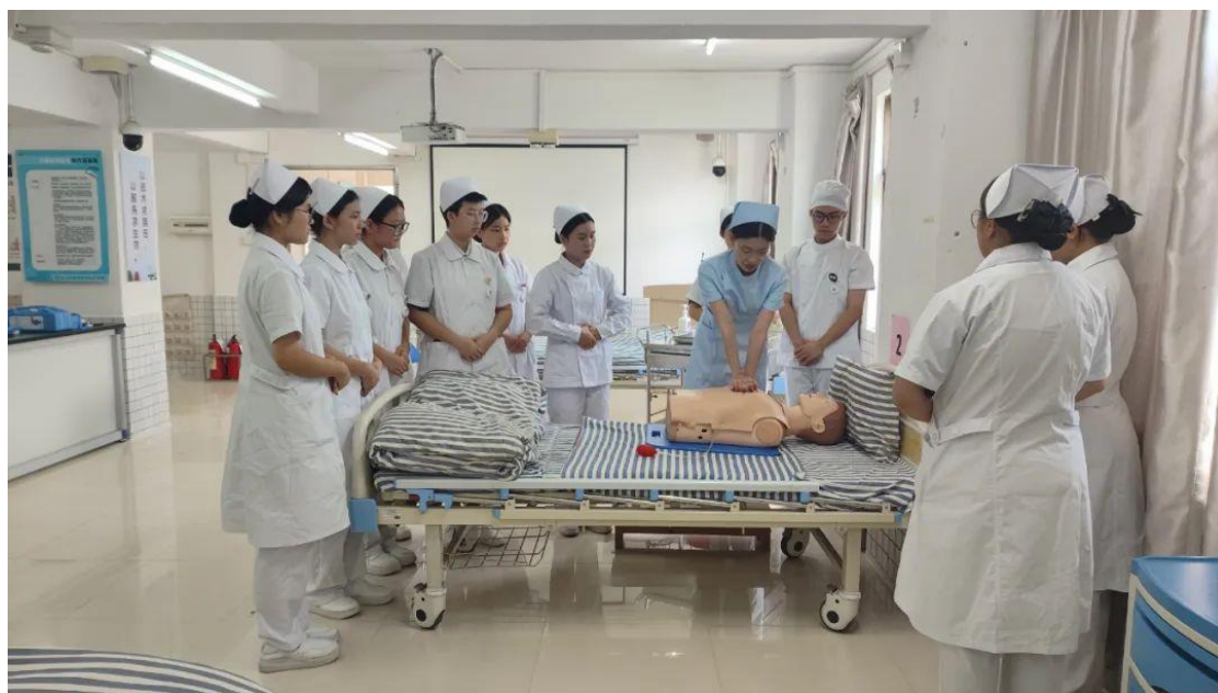
图 8 护理学生在老师指导下进行实操训练

今年,台山敬修职校 22 级护理专业 282 名学生参加考试,229 人通过,总通过率达 81.21%。其中,22 级护理 2 班 54 名学生全部通过,通过率 100%,创下学校历史纪录。陈思杏同学还通过春季高考考入韶关学院护理学专业,攻读大学本科。