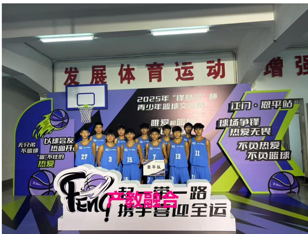
图 4-1 产教融合 1

生创业行为提供新的平台和思路。学校利用学生不同的专业属性进行针对性培养，摒弃面向“教师”或“教练员”对学生进行的单一化专业教学，学生在实施创业行为时也将有更多的选择和机会。体育专业的教学课程主要涉及理论知识和技能实践两个方面。教师在教学中传授基本理论与技能的同时，提高学生对体育产业、创业意识的认知，让学生了解更多本专业的前沿性，而非片面了解体育就业环境，提升学生的眼界，激发体育专业学生的创业兴趣。创业课程体系应该包括课程体系和非课程体系。学校为学生提供与创新创业相关的理论课程，还与政府、体育社会组织等多主体友好合作，为学生提供更多的社会实践课程、社会实践活动、模拟创业环节或讲座等。通过三管齐下，真正推动体育产业、体育专业、双创教育的同步发展。