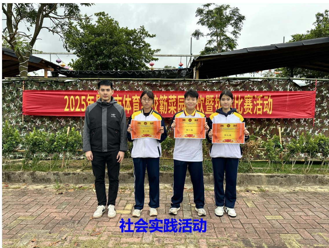
图 1-5 社会实践活动 1

学校坚持以对后进生的帮助转化教育工作为突破口，通过校园活动、主题班会等，重点对学生进行爱国主义教育、心理健康教育、法制教育、职业道德教育、传统文化教育和行为规范教育等，形成了“自我管理、自我教育、自我服务”的德育特色，收到了较好的育人效果。学校制定有具体的学生操行测评办法——“学生综合素质评价系统”，实现对每位学生建立操行考评档案，每学期组织学生进行操行评定工作。学校由政教处、团委会带领学生科建立“学生综合素质测评体系”，监测学生思想政治情况，近年来学生德育考核合格率达 100%，优秀率 16.13%。