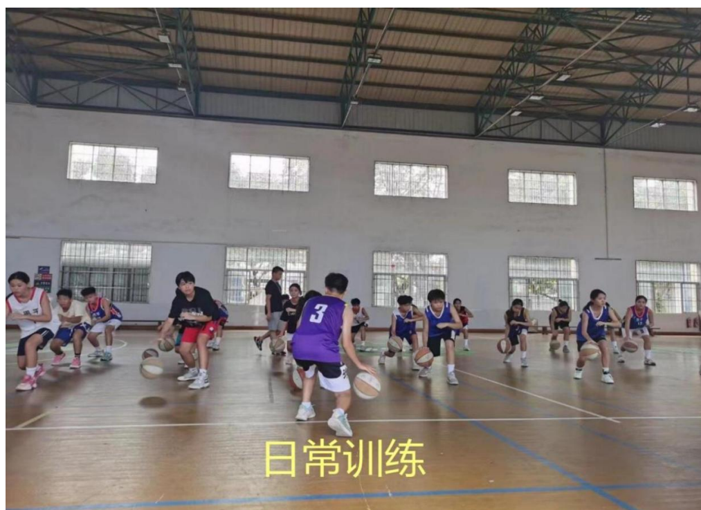
图 1-19 日常训练 1

学校认真组织学生文化教育学习，每天上午、晚上进行文化学习，下午进行体育训练，学校对学生的日常考勤进行严格管理，保证学生能够除参加外出比赛训练外的正常文化学习。学校各项活动贯穿全年始终，全面提高学生的综合素质，学生对在校理论学习满意度、专业学习满意度、实习实训满意度等校园生活的各个方面满意度高。