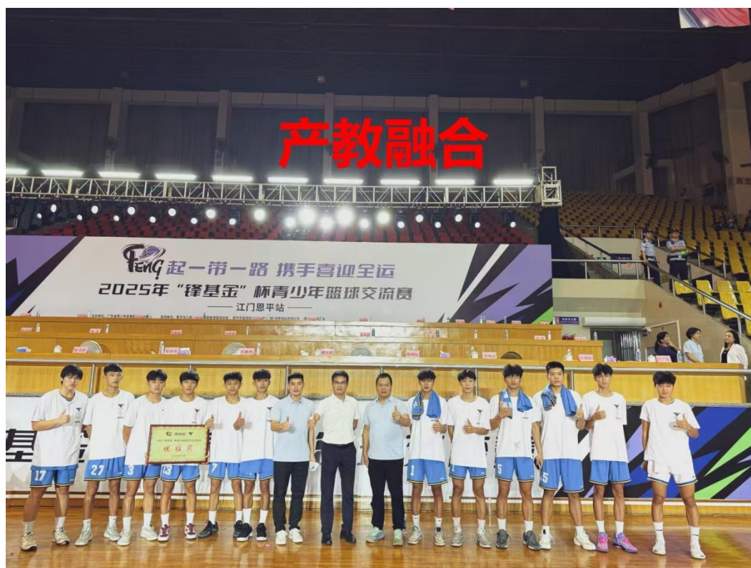
图 4-3 产教融合 3