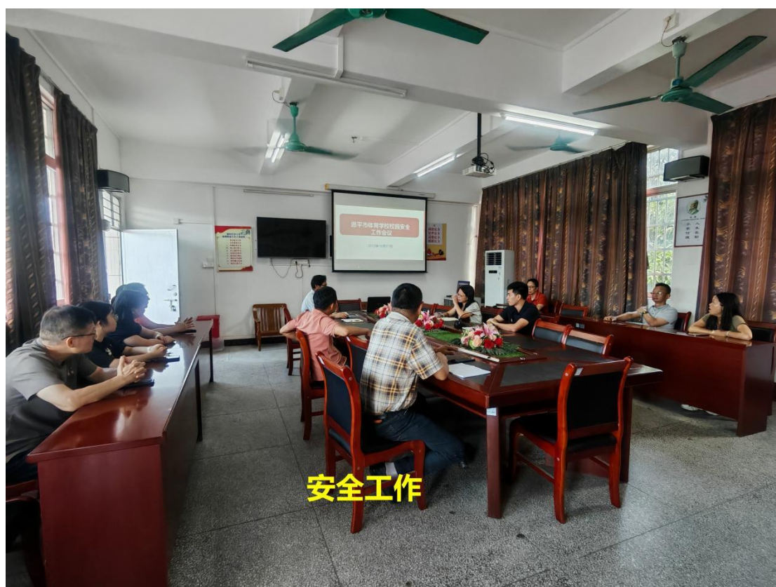
图 5-3 安全工作会议

恩平市体育学校每年组织全体在校生进行两次法纪教育，开展禁毒、防诈骗、防火、防盗、防爆、交通安全等方面的活动，并定期在学校宣传栏处宣传相关的知识。对全校师生开展普法考核。定期进行全校安全大检查和消防工作演习。确保学校安全无事故。