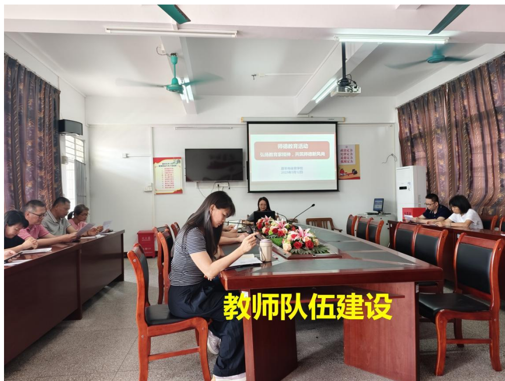
图 5-2 教师队伍建设 2