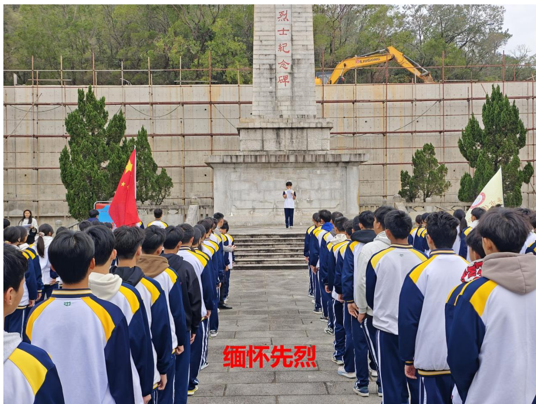
图 3-1 缅怀先烈活动 1

内协同育人团队。五是充分发挥博物馆、纪念馆、爱国主义教育基地、历史文化遗迹的育人功能，拓展校外育人空间，六是充分利用传统节日如清明节、中秋节、国庆节等开展爱国主义教育。七是强化组织协调和部门联动，构建大中小学段融通互动、家校社协同用力的中华优秀传统文化教育格局，推动中华优秀传统文化教育融入日常生活，引导青少年成长为中华优秀传统文化的继承者、弘扬者。