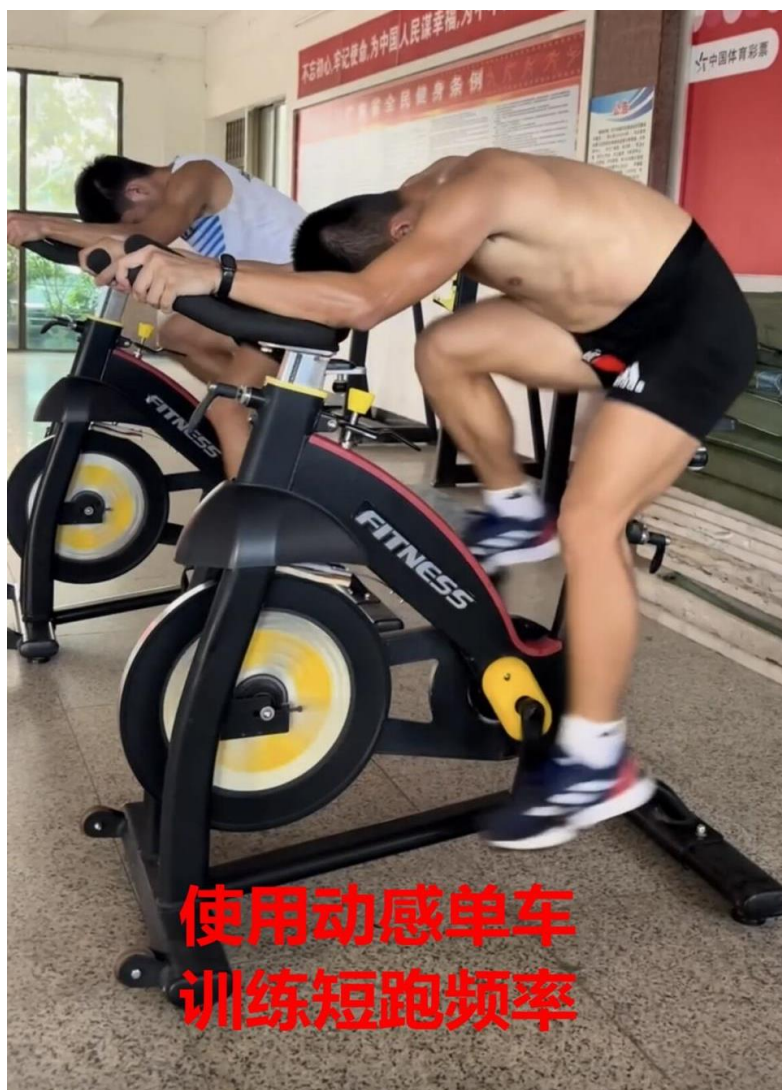
图 1-18 田径队使用动感单车训练

另一方面，继续扎实地抓好文化课教学，认真贯彻执行《职业教育法》《关于推动现代职业教育高质量发展的意见》《国家职业教育改革实施方案》等文件精神，并严格执行相关的教学改革，做好课程计划，切实提高学生的综合素质，为社会培养德、智、体、美、劳全面发展的，具有体育专业技能的中等体育专业人才。根据竞技体育人才的培养特点，我校课程设置涵盖义务教育阶段以及中职教育阶段。义务教育阶段课程按教育部门所制订的义务教育课程